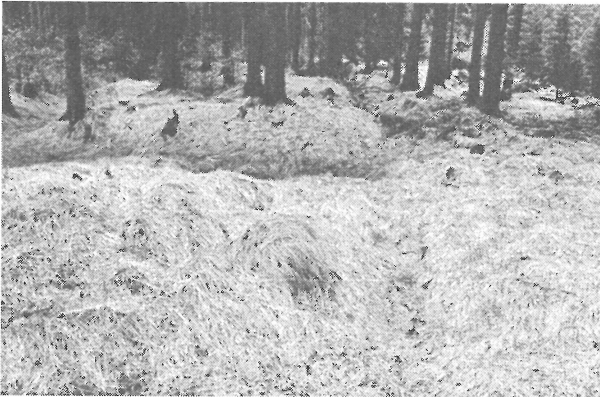
Nadzemní relikty porostlé starým lesem.

dlouhý 145 metrů, obklopený po celém svém obvodu příkopem různé šířky a hloubky. Na severní straně je příkop mělčí a užší, jižní strana vykazuje opačný stav. Příkopy jsou mezi sebou navzájem propojené ať už příčně, tak i podélně, jak ukazuje přiložený plánec místa a vytváří tak 25 stejně vysokých, ale vzájemně různě velikých a půdorysně odlišných reliktvů. Průměrná hloubka příkopů je kolem šedesáti centimetrů, ale není výjimkou příkop hluboký 120 centimetrů. Šířka se pohybuje od 80 do 150 centimetrů a v jednom případě tvoří příkop plošinu cca 15 x 12 metrů. Jiný příkop tvoří plošinu nepravidelného půdorysu v níž je jáma rozměrů 3 x 5 metrů, hloubky zhruba 80 centimetrů, zanesené bahnem - možná pozůstatek po zemnici. Další příkop vede souběžně se severním příkopem a je jen málo patrný. Z našeho zaměření se ale potvrdila přímá souvislost s už popsanými relikty, neboť je také propojen se sousedním příkopem několika mělkými příkopy které od sebe oddělují dalších 7 více či méně patrných reliktvů. Žádný z příkopů nemá venkovní val, ani v náznaku a hlína získaná při hloubení příkopů byla navršena na jednotlivé relikty. To dokazuje i mírné převýšení reliktvů nad okolní terén. Celý objekt a okolí jsou řídké porostlé statnými smrkami stáří 120 - 150 let, což dokazují i letokruhy na pařezech ve východní plošině objektu, kde byly smrky nedávno odtěženy. Severně od objektu je mladý, hustý les stáří